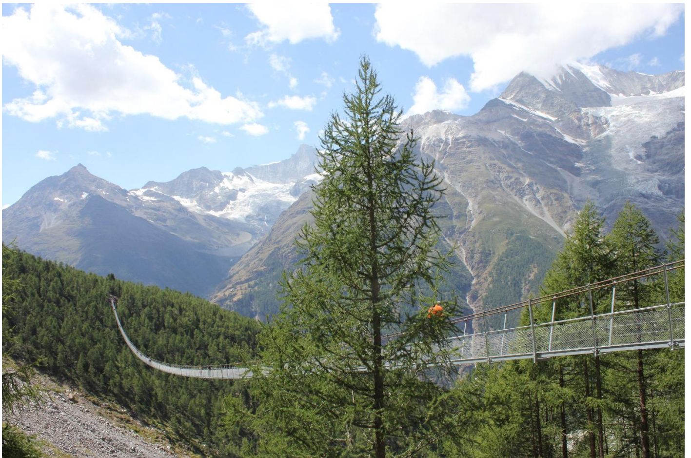
Hängebrücke Randa bei Zermatt – mit 494 Meter die längste Fußgängerhängebrücke der Welt